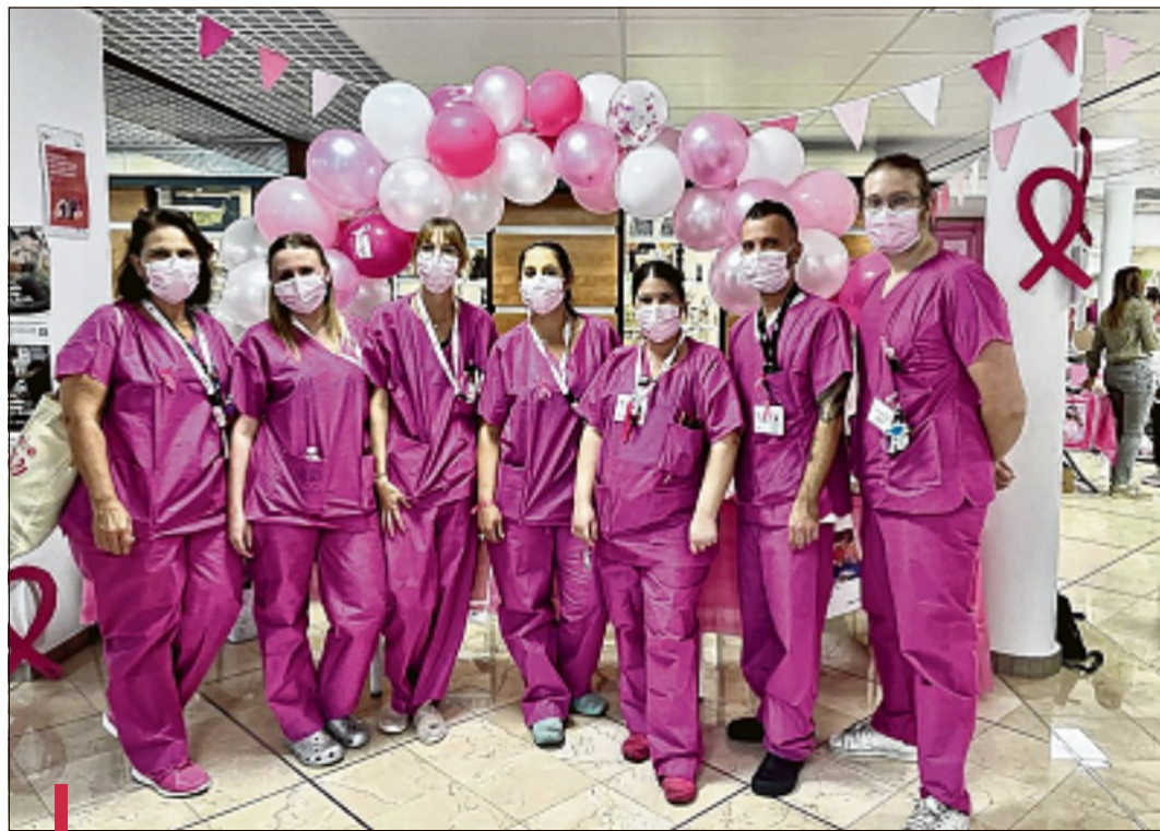
La journée d'animations a pu se dérouler grâce à l'investissement des adjoints de cadres, qui ont œuvré pendant plusieurs semaines afin que tout soit parfait.