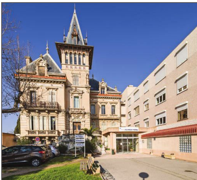
La clinique Vignoli accueille un centre de la main.

Un nouveauté, très spécifique, qui vient renforcer l'offre de soins de haute qualité et de proximité proposée aux patients du territoire. «Cette nouvelle activité s'inscrit dans la dynamique du Village santé qui rassemble la Clinique Vignoli et l'Hôpital du pays salonnais et complète